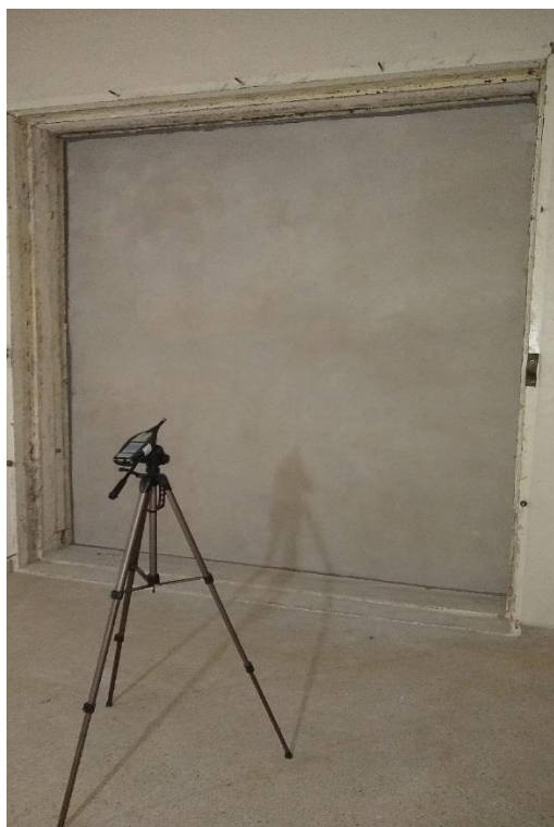
Fotografía 1: Montaje de ensayo en cámaras de transmisión (A-3540)

En el Gráfico 1 se muestran detalles de los ladrillos. En la Fotografía 1 se puede apreciar el montaje de ensayo.