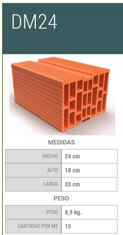
Gráfico 1: Ladrillo DM24